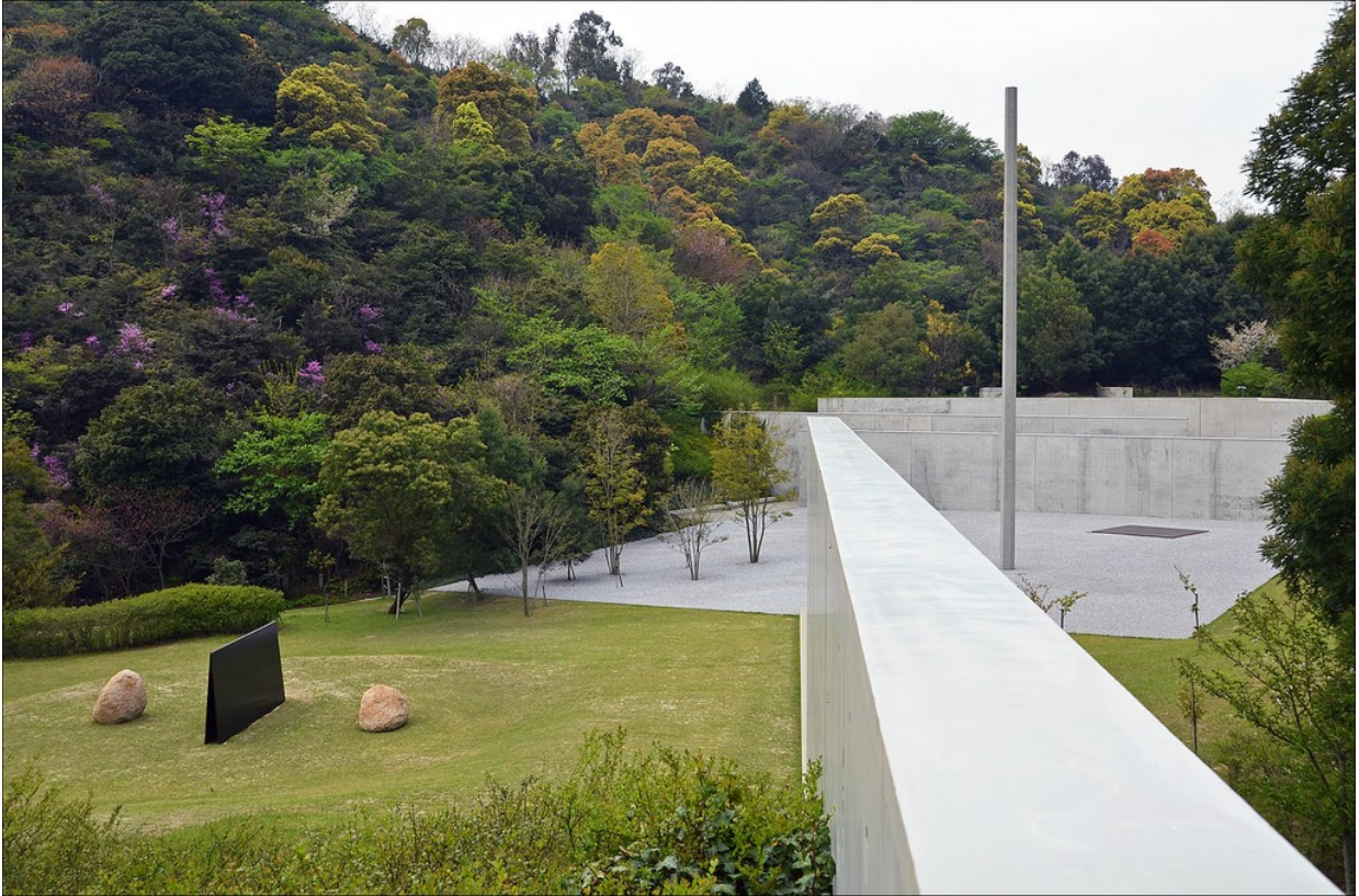
Lee Ufan museum - Naoshima

En annexe, nous vous avons également scanné le passeport qui était proposé en 2016, qui vous donnera une idée de la richesse des sites, mais aussi de la complexité de l'organisation.