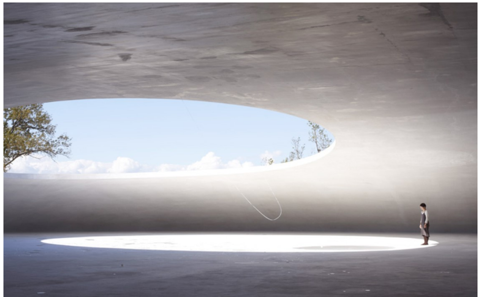
Teshima art museum