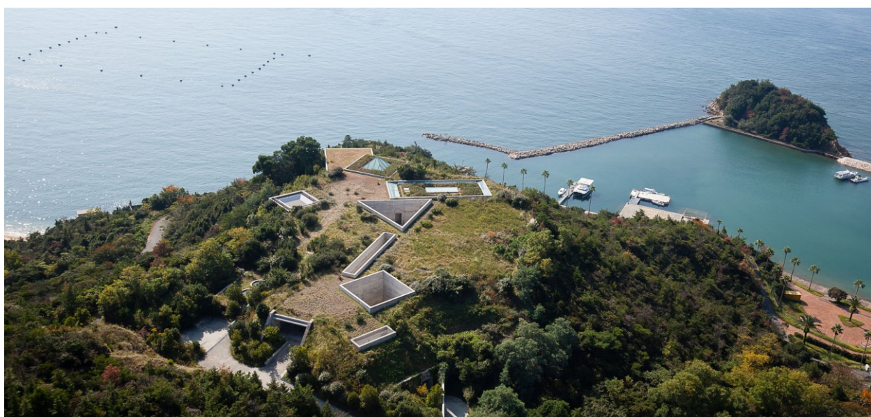
Chichu art museum - Naoshima

- Extension à Koyasan, Kyoto et Nara : du 22 au 28 septembre ou du 5 au 12 octobre 2019 : prix par personne sur la base de 10 personnes pour 2 nuits dans un temple à Koyasan puis 5 nuits dans un hôtel à Kyoto avec l'hébergement de catégorie moyenne : ~1500.— CHF